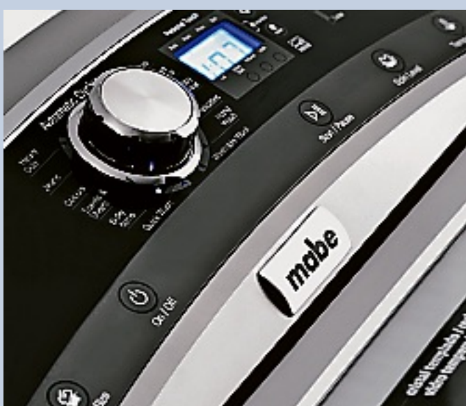
La primer lavadora en México distinguida con el sello de grado ecológico por CONAGUA.