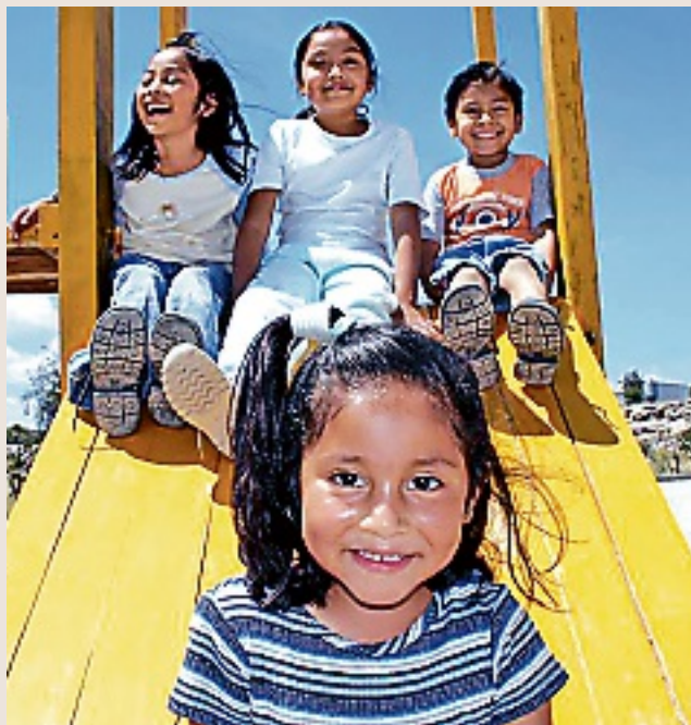
Aldeas Infantiles SOS está dedicada al cuidado infantil en situación de orfandad o abandono.