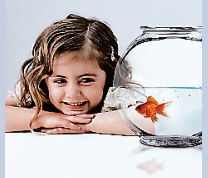
Con este ahorro de agua se puede dar de beber a una persona hasta 68 años.