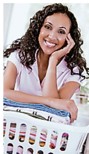
Con aqua saver ahorra hasta 120 litros por cada carga.

La tecnología aqua saver de Mabe, es 100 por ciento mexicana y fue la primera lavadora en obtener el "Sello de Grado Ecológico" otorgado por la CONAGUA en 2012, esto por cumplir satisfactoriamente los requerimientos que la ANCE (Asociación de Normalización y Certificación) que implementa para aquellos productos que cumplan con la funcionalidad de ahorro de agua, energía y un uso eficiente de lavado.