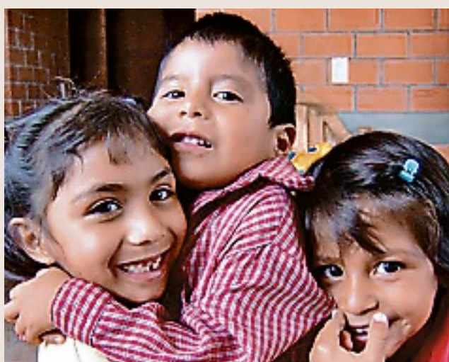
El donativo de Mabe es lo equivalente al ahorro de agua de una lavadora en un año.

Mabe, además, está implementando programas de responsabilidad social que conlleven a la educación y concientización de la importancia del ahorro del agua en los hogares. Por ello, este año están apoyando con la donación de 2 mil 500 garrafones de 20 litros de agua a Aldeas Infantiles SOS, lo equivalente al ahorro de agua de una sola lavadora en un periodo de un año.