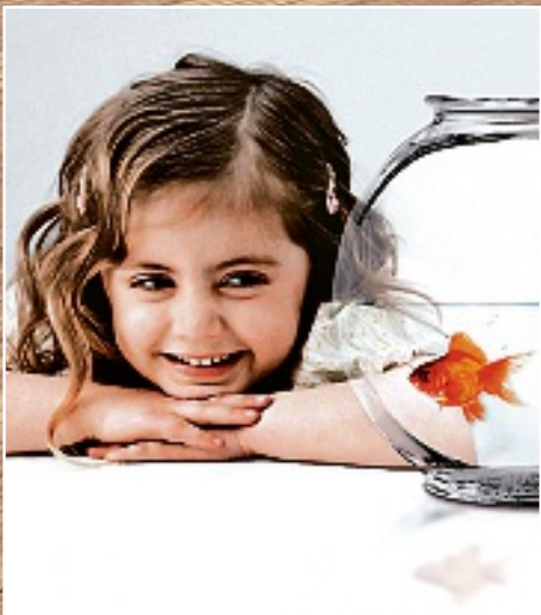
Con este ahorro de agua se puede dar de beber a una persona hasta 68 años.