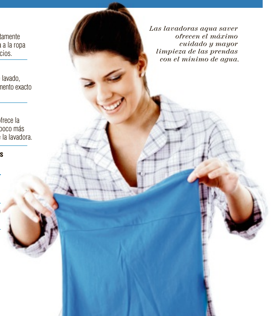
Las lavadoras aqua saver ofrecen el máximo cuidado y mayor limpieza de las prendas con el mínimo de agua.