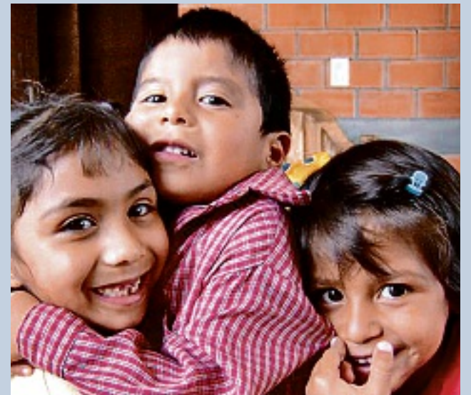
El donativo de mabe es lo equivalente al ahorro de agua de una lavadora en un año.

Como parte de sus acciones de responsabilidad social, mabe donará 2 mil 500 garrafones de agua a Aldeas Infantiles, lo equivalente al ahorro de agua de una sola lavadora en un periodo de un año.