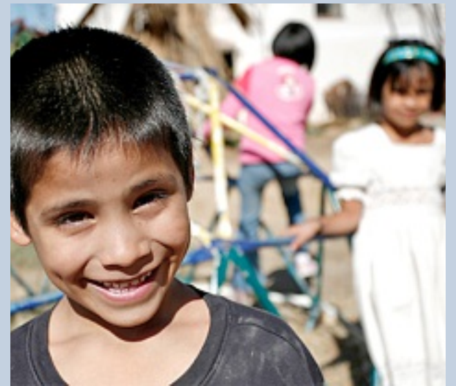
Aldeas Infantiles SOS está dedicada al cuidado infantil en situación de orfandad o abandono.

Estas lavadoras cuentan con una capacidad de 18 y 19 kilogramos que permiten ahorrar hasta 120 litros de agua por carga y hasta 50 mil litros al año.