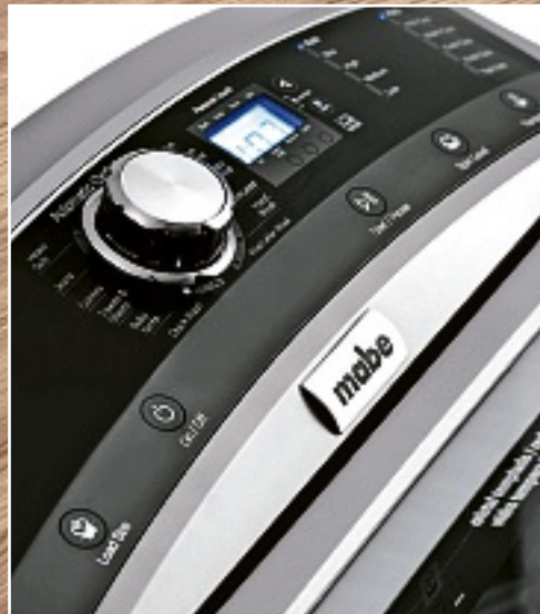
La primera lavadora en México distinguida con el sello de grado ecológico por CONAGUA.