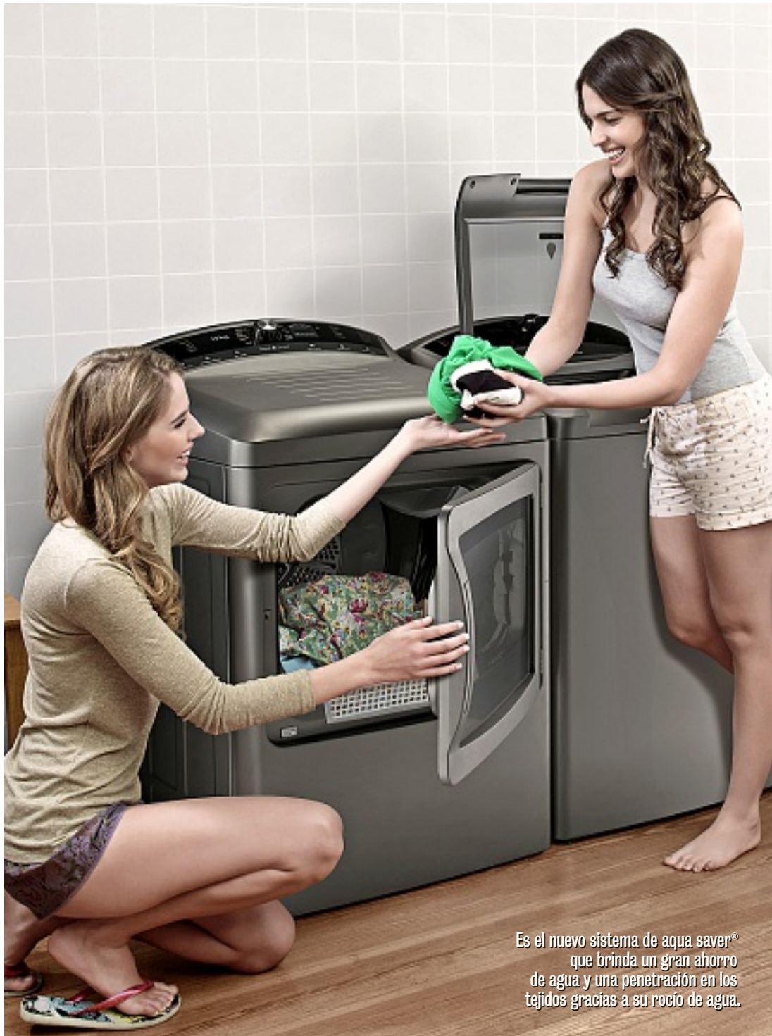
Es el nuevo sistema de aqua saver® que brinda un gran ahorro de agua y una penetración en los tejidos gracias a su rocío de agua.

Gerente de Ventas: Sergio Flores. Editor: Alejandro Jiménez. | 3134-3550 | sociales@mural.com